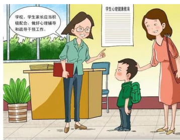
学校、学生家长应积极配合，加强学生生命教育和心理健康教育，做好心理辅导和疏导干预工作。学生有特异体质、特定疾病或者其他异常生理、心理情况，不宜参加正常教育教学活动的，学生监护人或者成年学生应当向学校书面说明情况。

青少年遭受心理问题的困扰或患有精神心理疾病的现象并不罕见，只要做到早识别、早干预、早治疗，他们中的大部分人都可以康复并回归社会。有很多艺术家、科学家在青少年时期都曾出现过心理问题，但这并没有阻止他们在人类历史上留下浓墨重彩的一笔。